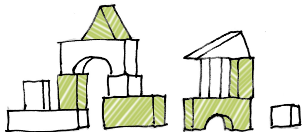
Abbildung: complan Kommunalberatung

Dann bewerben Sie sich mit Ihrer Projektidee um Mittel aus dem Aktionsfonds Siekerleben.